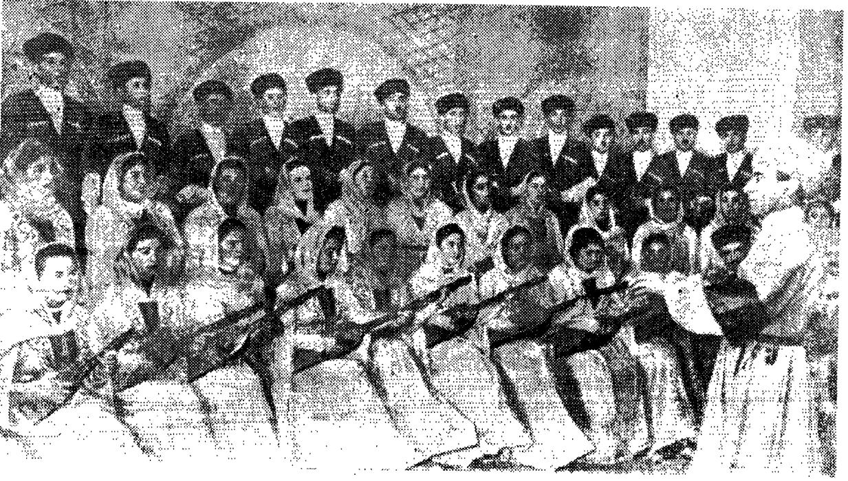
Kuzey Kafkasyada Güney Osetin Dans ve Müzik Topluluğu