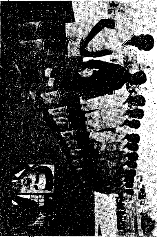
Eİnadıel Ehlî Futbol Takımı