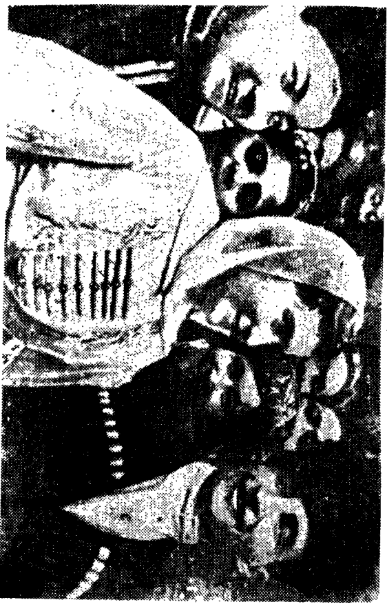
(Kızye Kafkasçada Bir Düşün)

Yeni evliler yerleşir yerleşmez gelin annesinin öğrettiği şekilde kendine