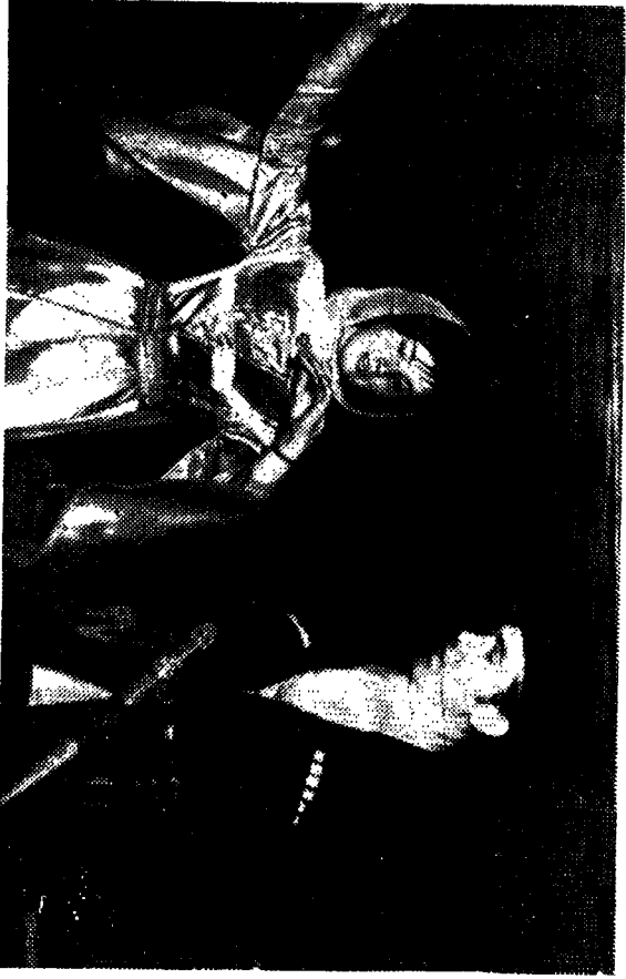
Geceden Bir Görünüş (Semiz ve Daryal Geçen Oynarlarken)