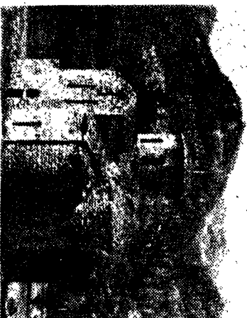
ZELENÇUK (Haftsey) Kilisesi

Eski rivayetlerde görüldüğüne göre bu binalar rahiplerle papasların ikamet yerleri idi. Ayrıca KUBAN arkasında KEFAR nehri kaynakları yanında ve ZELENÇUK nehri kıyısında bulunan taş binalar da (ALLİG XE YA VUNE ALLİG CHEYA VUNE) adını alır. Bunun anlamı «Grek (yunan) lerin evi» dir. Çok mühtemeldir ki Çerkeslerle ticari muamele ve mübadelelerde bulunan Yunanlılar tarafından inşa edilmiştir. Bunların eski manastır ve kiliselerden başka bir şey olmaları da akla gelir.