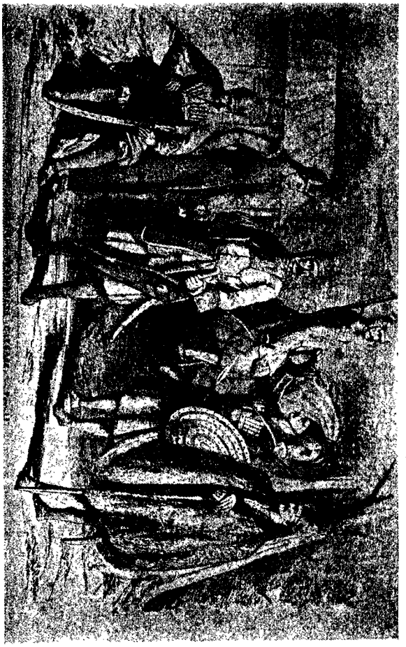
Kuzey Kafkasyalı Muharipler

(1) Periplus Ponti Euxeni. Maris Erythraei adı verilen ARRIAN'ın kitabında bu şekli ile belirtilir. Yunanlılar bu adı Karadenizin doğu kıyılarında oturan millete derlerdi. Yazar ARRIAN diyor ki: Bu millet, bugüne kadar yaşayan Çerkes J A N daniandan başka bir şey olmayan SANICH—SANIKH halkı ile komşu idi. ACHEI ırmağı da SANIKH, ZİĞİ ayıran bir sınırdır. (ASIA Poygiotta, J. KLAPPROTH. Paris. 1831 kitabına bakınız). (2) KEREKET'ler haddi zatında bir halk topluluğudur. Onlarda ADİGE milletine mensuplardır. Bu milletin bir kısmı olan S I N D'ler de aynı halde bu milletin bir parçasıdır. (3) Description geographiques de la Georgie,