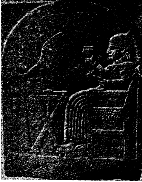
Hâti kraliçesi yemek yerken.

mahkûm edilecek bütün suçlu'lar için en son kararı kral tarafından verilirdi. Kraldan gerekirse daha hafif hükümler de beklenebilirdi. Bu zaten adil bir şekilde meydana getirilen kanun meclisinde tasrih edilmişti. Hâtîlerde adâleti temin eden, fakirleri aç bırakmayan, hastaları ihmal etmeyen, boyunduruk altındakilerini ve esirleri yağmaya karşı koruyan, devlete ve ülkeye dirlik düzenlik veren her kral, ideal kral olarak tanınırdı. Kral her şeyden önce bir devlet adamı ve bir başkumandan idi. Metinler hep böyle der.. Bu metinler Ön Asya'nın elimizdeki en eski metinlerdir. Yazıların tümü kat'i olarak geçmiş olan olaylardır. Mısır tarihçilerinin yapmış oldukları gibi gerçekten uzak öyle olur olmaz düzme yalanlara Baş vurmamışlardır. Kral ordunun başından ayrılmazdı, yalnız kış gelince dinî görevini görebilmek için karargâhını hükümet merkezine naklederdi.