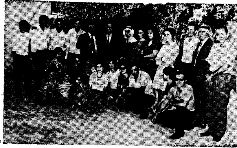
Vadisirli kardeşlerimiz arasında.

Ürdün'de cereyan eden son olaylarda buradaki kardeşlerimiz bir hayli korkulu anlar yaşamışlar. Bu olaylar biraz da onlara karşı bir tutuma girmiş. Şimdi durumları düzelmiş ama bu olay onlara bazı şeyler yapmanın gerekliliğini anlatmış. Değirmek uygun düşmeyeceğinden şimdilik geçiyoruz bu konuyu. Ama gerçekten üzerinde durulacak çok önemli bir olay. «Bizim başımıza birşey gelse, daha açıkçası bir imha olayı ile karşılaşsaydık Türkiye'deki Adigeler bizim için ne yapabiliriniz?» diye soruyorlar. Bunu ben de uzun uzun düşündüm. Evet böyle bir olay karşısında ne yap-