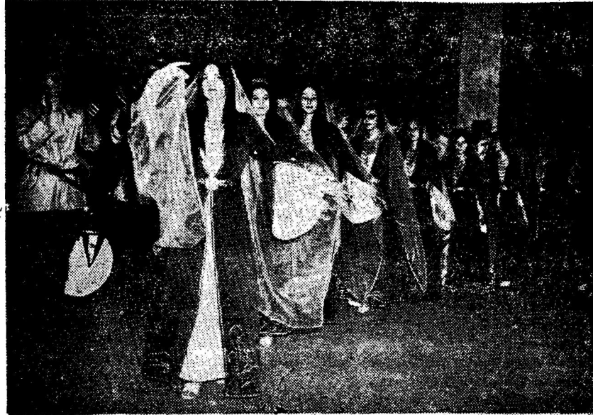
Suriye (ŞAM) Çerkes Derneği Folklor ekibi bir gösteride.