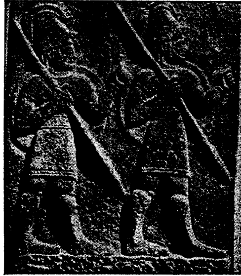
Hâtilerde muhafız askerler

Yazılıkaya yan galerisinde bir kral rölyefinde (hak edilmiş taş) ismi Hiyeroglif yazısı ile sağ tarafında yukarıda gösterilmiştir, ve kat'î olarak (Tudhalya 4) olduğu anlaşılmıştır. Kral kendisinden büyük olan ve bir erkek şeklinde tasvir edilen bir kişi tarafından kucaklanmış vaziyettedir. Kucaklıyanın fırtına tanrısı (DATTAŞ) olduğu hiyeroglif yazısından anlaşılmaktadır. Tanrının başında sivri bir külâh vardır ki bu çeşit külâhları fırsat düştükçe krallar da başlarına giyerlerdi. Kral ile Tanrı arasında böyle samimi bir vaziyet doğuda o zamana kadar ilk görülen bir vakıdır.